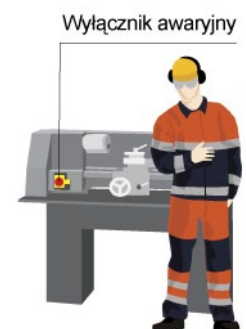
Rys. 1. Wyłącznik awaryjny