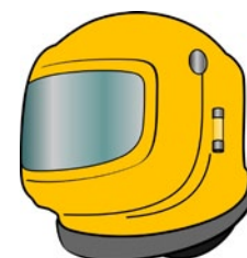
Rys. 3. Hełm do piaskowania