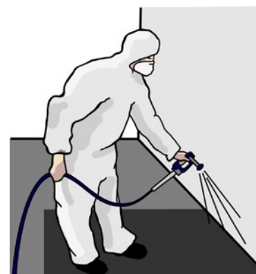
Rys. 4. Prace malarskie – ochrona dróg oddechowych