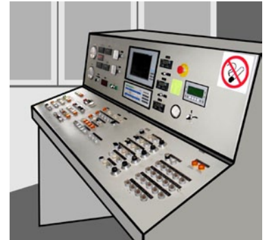
Rys. 3. System sterowania procesem produkcji