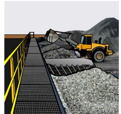
Rys. 4. Zabezpieczenie zbiorników zasypowych