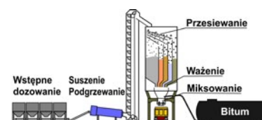
Rys. 2. Wytwarzanie mas bitumicznych