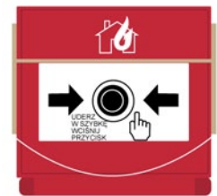
Rys. 1. Ręczny ostrzegacz pożarowy (ROP)