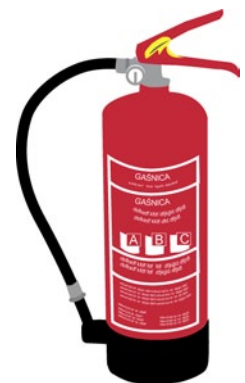
Rys. 2. Gaśnica proszkowa do gaszenia pożarów typu A, B, C