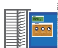
Rys. 4. Dostęp i zabezpieczenie budów