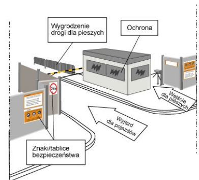
Rys. 1. Zabezpieczenie placu budowy