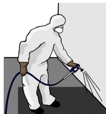
Rys. 4. Malowanie natryskowe