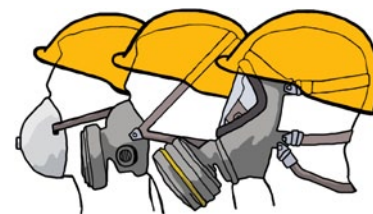
Rys. 3. Ochrony dróg oddechowych