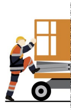
Рис. 5. Безопасная посадка в люльку