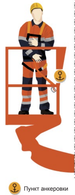
Рис. 1. Пункт анкеровки в корзине мобильного подъемника