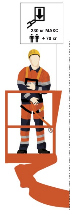
Рис. 2. Информация о допустимой нагрузке платформы мобильного подъемника